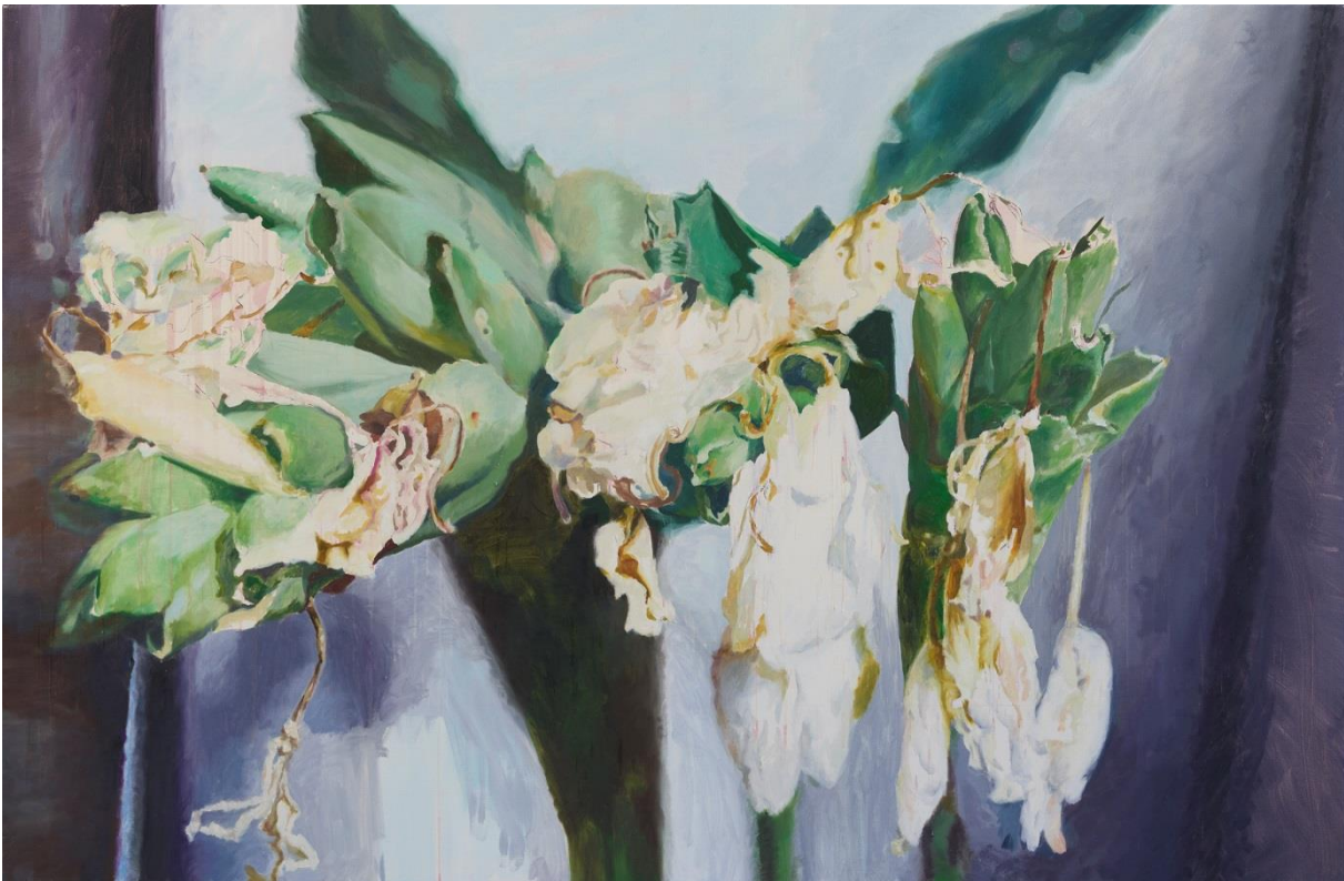
鄭君殿，野薑花 170528，2017，油彩／畫布，141 x 215 cm

JENG Jundian, Ginger Lily 170528 , 2017, Oil on canvas, 141 x 215 cm